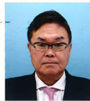
福井青年会議所シニアクラブ 会長

福井青年会議所の皆様には、地域経済の発展を担う要として、より一層の目覚ましいご活躍に大きな期待をいたしております。地域経済・社会の持続的な発展のため、福井商工会議所と共に連携協働して取り組んでまいりましょう。