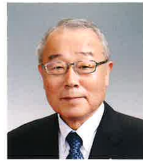
名誉顧問 福井商工会議所 会長

結びに、皆様をますますのご活躍とご多幸を心より祈念申し上げます、あいさついたします。