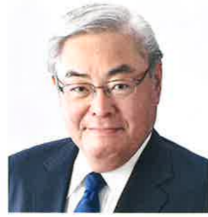
名誉顧問 福井市長

皆様におかれては、次代を担うリーダーとして、ふくいの未来をつくるチャレンジの先頭に立ち、地域の新たな価値の創造のため若い力を存分に発揮していただくことをご期待申し上げます。