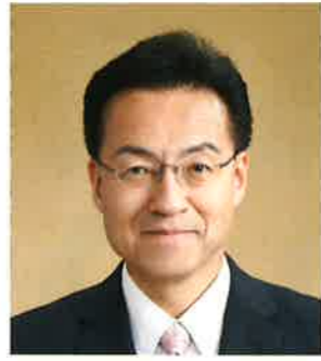
名誉顧問 福井県知事