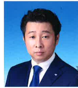
一般社団法人 熊本青年会議所 2021年度 第67代 理事長

昨年、新型コロナウイルス感染症の拡大は、地域や経済において、大きな影響を与えました。そして、新しい生活様式をはじめ、様々な物事に変化が生まれようとしています。新しい年を迎え、そのような困難と変化の激しい状況が入り混じる中、創始の精神の通り、このような時代だからこそ、明るい豊かな社会の実現に向けて全力を尽くすことが求められているのです。2021年度は、「全ては我にあり」のスローガンのもと、福井青年会議所メンバーには、謙虚に、全ての物事を自分事と捉え、本音で、本気で熱く語り合い一丸となって運動を展開してほしいと思っています。また、創立60周年を控えた年となります。メンバー一人ひとりが責任ある行動で、この伝統ある福井青年会議所という組織をさらに成長させていってほしいと願っています。最後に、時代に即した新たな価値を創造する一方で、青年らしく果敢に挑戦し、ふくいの希望となることを大いに期待しまして、現役諸君へのメッセージといたします。