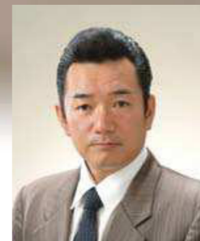
福井青年会議所 シニアクラブ 代表幹事

本年の現役諸君の活動が実り多きものなることをご祈念申し上げ、年頭の挨拶とさせていただきます。