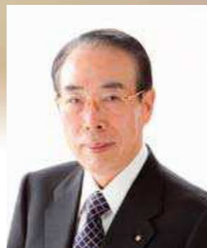
名誉顧問 福井商工会議所 会頭

あけましておめでとうございます。福井青年会議所の皆様方には、希望に満ちた新たな年をお迎えになられたこととお喜び申し上げます。昨年は、北陸新幹線金沢—敦賀間のルート確定のための中心線測量の開始や福井駅西口中央地区市街地再開発事業の進展など重要な事業が動き出した年でありました。特に、福井駅西口再開発ビルにつきましては、ドームシアターや観光関連施設、多目的ホールを備えた複合施設を、県都の玄関口の賑わい交流拠点として、平成28年度春の完成を目指し整備を行っております。本市といたしましても、皆様の若く力強い行動力に後押しいただきながら「県都デザイン戦略」の実現に向け、県都の魅力高めるまちづくりを一層進めてまいりたいと考えております。年頭にあたり、皆様方の御多幸を祈念いたしますとともに、本年も格別のお力添えをいただきますようお願い申し上げます。