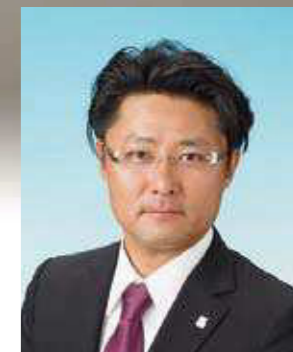
一般社団法人 熊本青年会議所 2014年度 理事長

今年は、福井JCも公益社団法人となって新たな一歩を踏み出すとともに、水原JCとの姉妹結50周年など歴史と伝統に支えられた事業も控えています。今や全国会員大会福井大会を知るメンバーも皆無に等しく、経験の浅い中でも懸命に頑張っている現役メンバーの情熱と勇気、そして私たちシニアの豊富な経験と知恵を融合させることで、更なる福井JCの伝統と歴史を築いていけたら幸いかと存じます。微力ではありますが代表幹事として精進して参りますので、どうぞよろしくお祈り申し上げます。