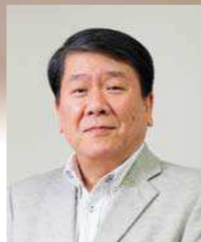
福井青年会議所 シニアクラブ 会長

皆さまのますますのご隆盛とご健勝を心からお祈り申し上げ、年頭のごあいさつといたします。