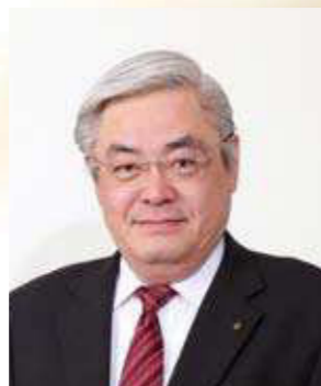
名誉顧問 福井市長

福井青年会議所におかれましては、一層、福井の発展に取り組まれますよう期待するとともに、皆様のますますのご多幸とご活躍をお祈り申し上げまして、新年のご挨拶といたします。