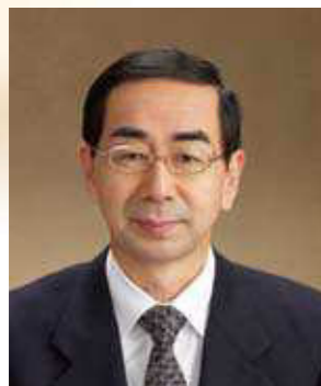
名誉顧問 福井県知事