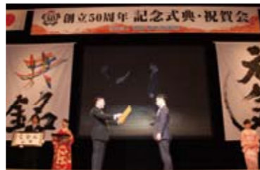
スポンサーJCである金沢JCへ感謝の意を込めて感謝状と記念品贈呈。