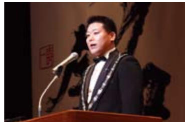
これまでの福井JCを築き上げてきた諸先輩方への感謝と、これからも高い志を持って歩んでいくという決意表明をされました。