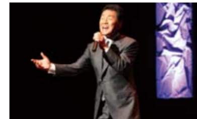
スペシャルゲストの五木ひろし氏に新曲も含め、熱唱していただきました。