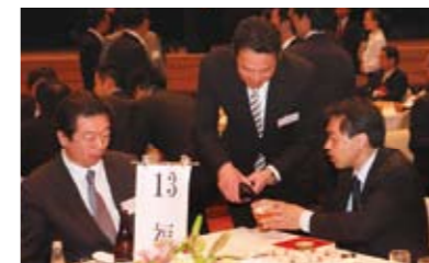
ご指導、ご鞭撻を頂いた先輩の皆様本当にありがとうございました。