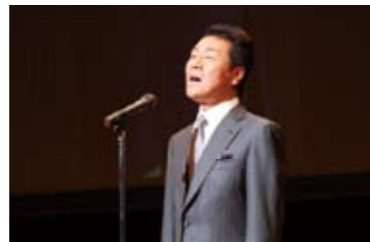
サプライズゲストで登場した五木ひろし氏による国歌斉唱。