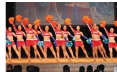
福井の夢を追いかける高校生JETS(福井商業高校チアリーダー部)が、オープニングで会場を盛り上げてくれました。