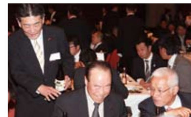
何を話されているか気になりますが、楽しんでいただけているようなので安心。