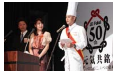
乾杯の後は、ユアーズホテルシェフによるコース料理が紹介されました。