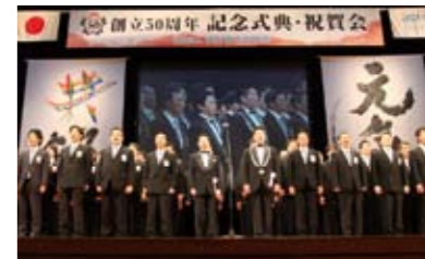
最後は全員での「JCI Creed」合唱で、これからの福井JCへの気持ちをさらに高める機会になりました。