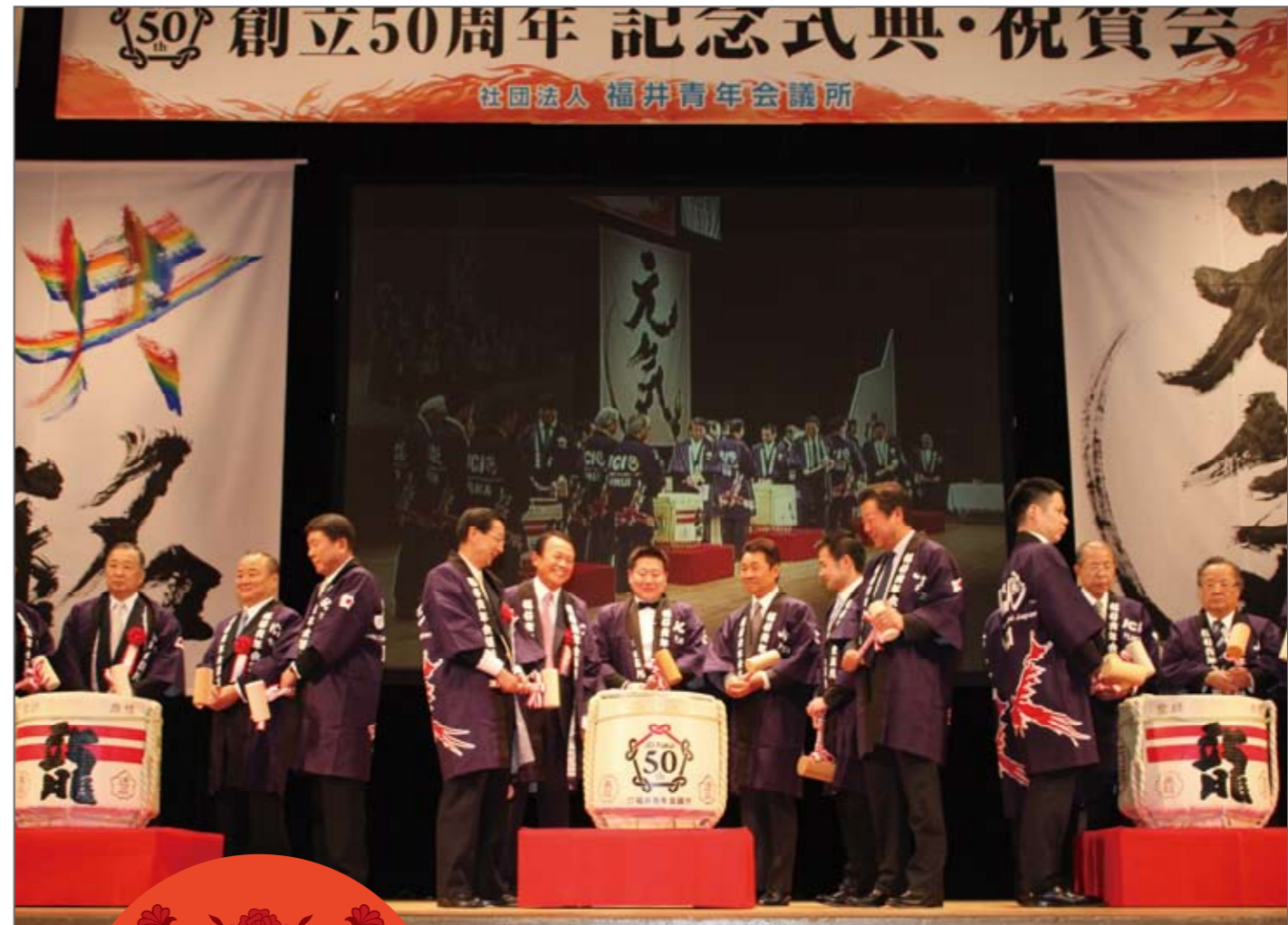
福井JCのこれからの発展を願い、多数のご来賓の方々とお祝いの鏡開き。