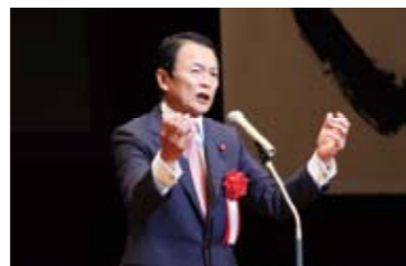
日本JC第27代会頭の麻生先輩からは、JCとして若者としての指針を頂きました。