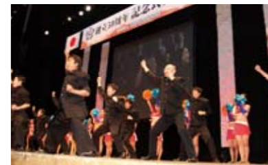
続いて、JETSとのコラボにより会員開発委員会が熱い気持ちを披露しました。